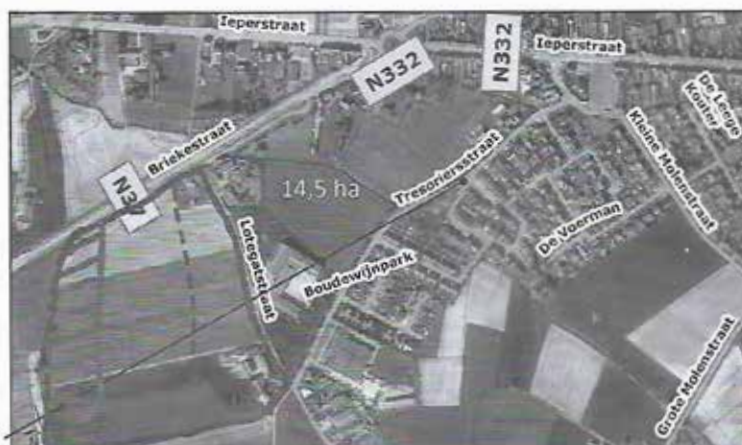
Figuur 1: voorstel bedrijventerrein #TEAM888

Het ‘nieuwe’ voorstel van het schepencollege voor een bedrijventerrein is krak hetzelfde als hun -afgekeurde- voorstel uit 2019.