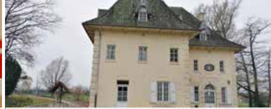
Gemiste kans (p. 3)